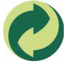
Rohelise Punkti märk

Eesti Taaskasutusorganisatsioon MTÜ kasutab oma kogumissüsteemi eristamiseks rahvusvaheliselt tuntud Rohelise Punkti märki, mis pakendile kantuna tähendab, et pakendiettevõtja finantseerib vastava pakendi ning sellest tekkiva pakendijäätme kogumist ja taaskasutamist Rohelise Punkti süsteemis.